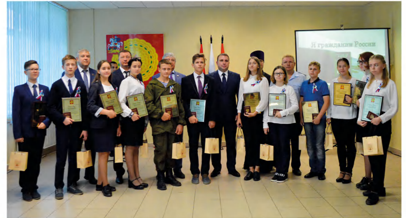
Общее фото на долгую память после торжественного вручения паспортов юным серпуховичам. Пролетят годы, а эти мальчишки и девчонки с трепетом будут вспоминать знаковый для них день.

Порядка ста человек, прославивших наш город своим самоотверженным трудом и подвигом, составили галерею Славы Серпухова.