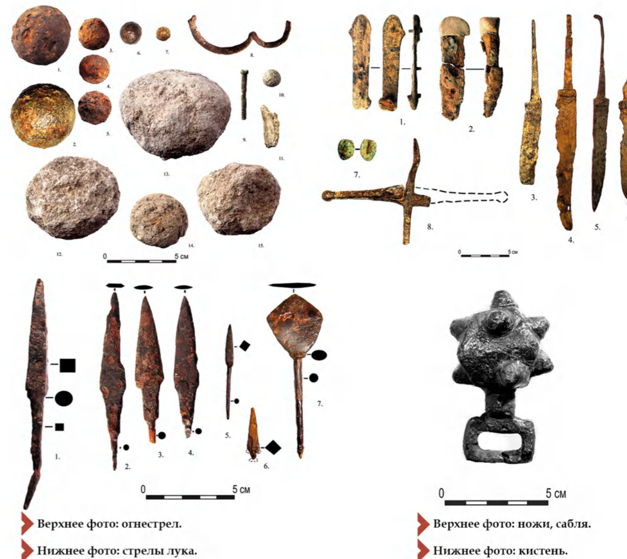
Верхнее фото: огнестрел. Нижнее фото: стрелы лука.