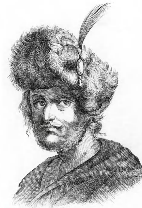
► Набросок портрета Лжедмитрия II.

Бояре Шуйского предприняли ряд военно-политических и внутривойсковых шагов для исправления ситуации. Шуйский накапливал силы. Вместе с тем в Тушинском лагере самозванца иностранные наемники все более давили на Лжедмитрия II, требуя выплат жалования. Тем временем в Серпухове появился эмиссар Лжедмитрия II ротмистр пан Анджей Млоцкий.