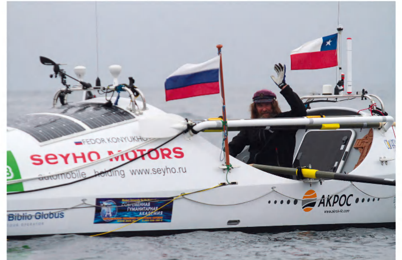
► Из дальних странствий возвратясь...

Вообще же, когда нас ругают, мы зачастую не знаем, что нам это идет на благо. Помню, в детстве, после моего первого перехода через Азовское море, отец взял и меня веревкой выпорол. Синяки были, и я на отца обиделся, а когда пришло время, когда у меня появились свои дети, то я понял, насколько папа был прав. Как бы я сам отнесся к этому?