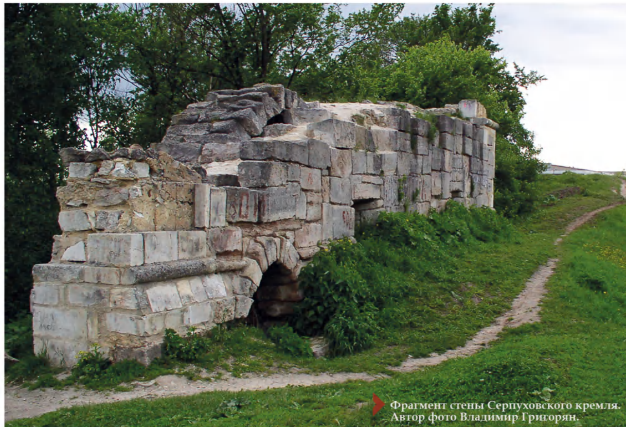
► Фрагмент стены Серпуховского кремля.

кое-какие регалии и пышные одеяния, сшитые по мерке в кремлевских мастерских. Лжедмитрий I въехал в Москву, где находился до смерти в мае 1606 г. Обман его был раскрыт, сам он был убит. Серпухов же вместе со всей Московией начался входить в полосу трагических событий, которые чуть не закончились полным разрушением русской государственности.