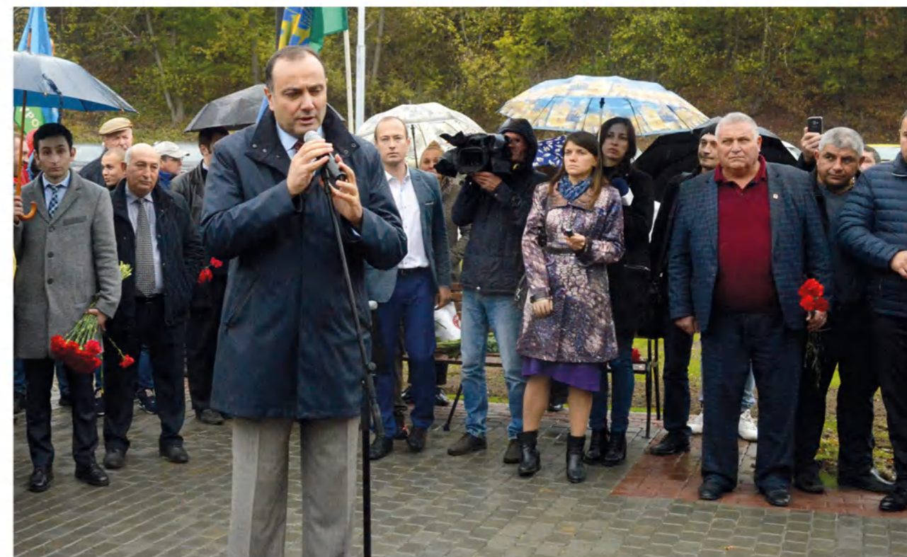
➤ Чрезвычайный и полномочный посол Армении в России Вардан Тоганян выразил надежду, что около хачкара люди будут проявлять друг к другу уважение.