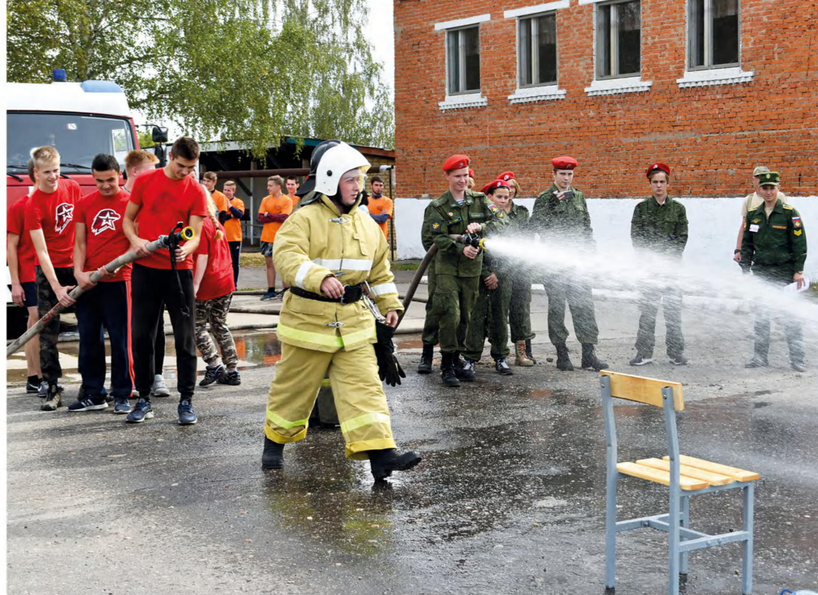
➤ На форуме все было по-взрослому и по-настоящему: даже пожарные брандспойты с ледяной водой.

В сентябрьские дни Серпухов стал символической площадкой, на которой собрались лучшие из лучших воспитанников военно-патриотических объединений Московской области: 29 команд из Люберец, Дубны, Клина, Одинцовского района, Павловского Посада, Подольска, Протвино, Ступино, Чехова, Химок и, конечно же, из Серпухова приняли участие в областном гражданско-патриотическом форуме «Серпуховский рубеж».