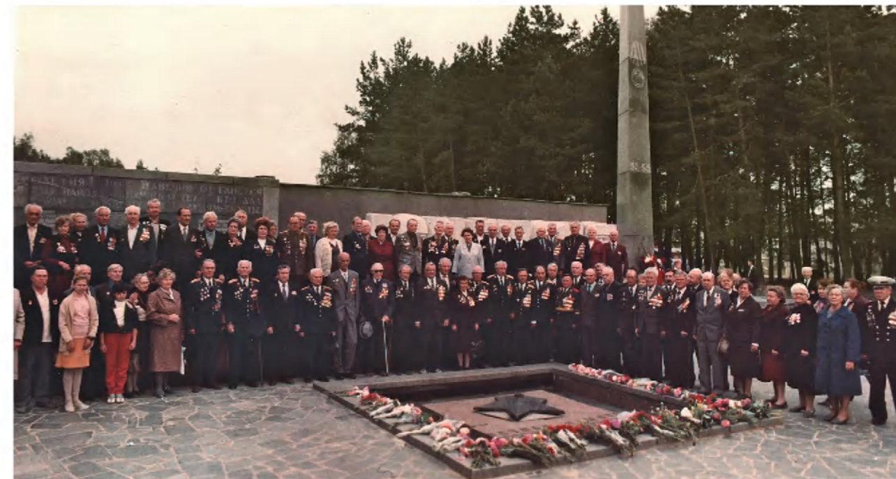
1989 год. Члены Серпуховской общественной организации ветеранов войны, труда, Вооруженных сил и правоохранительных органов Серпухова и Серпуховского района посетили мемориал в г. Кременки.

В основу работы Серпуховского Совета ветеранов легли положения о Совете ветеранов войны, утвержденные еще в 1980 году, а несколько позднее взят во внимание и Устав Всесоюзной организации ветеранов войны и труда, утвержденный Учредительной конференцией 17 декабря 1986 года. В принятом документе отмечалось, что организация Совета ветеранов строится по территориально-производственному принципу, то есть Советы ветеранов должны создаваться по месту работы или жительства ветеранов. Но важно, что в Серпухове эта работа уже велась три года, и ветеранская организация продемонстрировала положительные результаты.