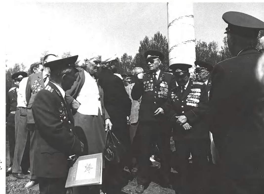
На открытии стелы памяти. Малеево поле, 1990 год.

селений к запросам ветеранских Советов относятся с пониманием и помогают решать многие непростые вопросы.