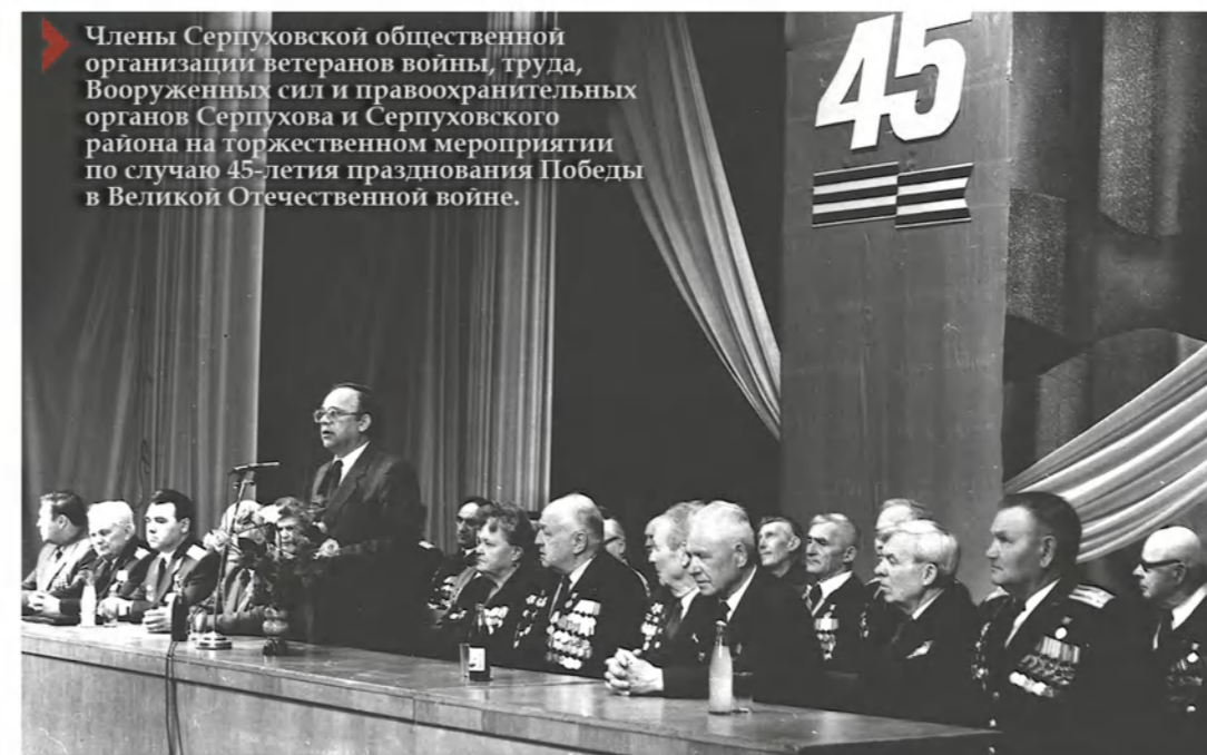
Члены Серпуховской общественной организации ветеранов войны, труда, Вооруженных сил и правоохранительных органов Серпухова и Серпуховского района на торжественном мероприятии по случаю 45-летия празднования Победы в Великой Отечественной войне.

Да, немало организационных хлопот: в Серпухове и Серпуховском районе насчитывается 39 тысяч ветеранов войны, труда, Вооруженных сил, правоохранительных органов, пенсионеров, при этом у людей с возрастом появляется необходимость в лечении, уходе, приобретении бесплатных лекарств. В основном просьбы больше носят частный характер. Из таких обращений формируется повседневная работа. Зачастую приходится обращаться за квалифицированной помощью к юристам или же к другим специалистам. При этом руководители администраций города и района, сельских по-