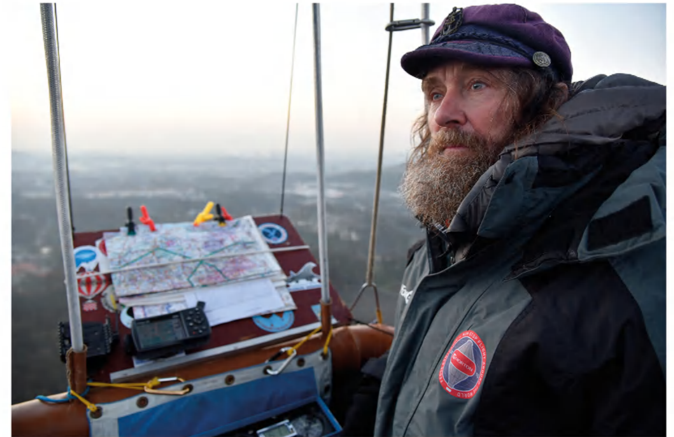
▶ Федор Конюхов не боится даже самых громких вызовов.

— Федор Филиппович, мы с вами встречаемся накануне празднования Дня народного единства. Но сам этот праздник еще совсем молодой. Как вы думаете, правильно, что его масштаб стал всероссийским?