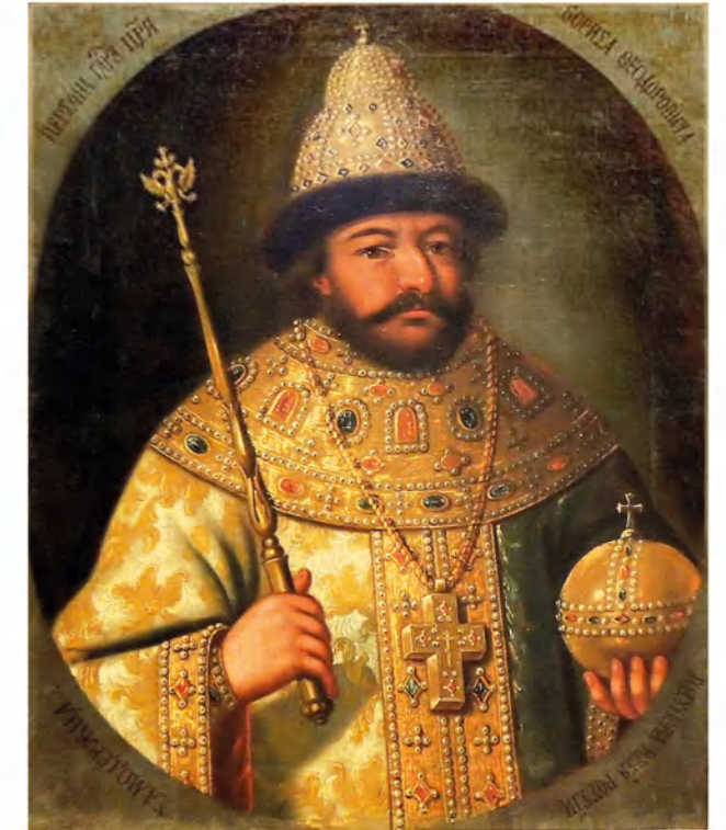
► Борис Годунов.

По словам немецкого офицера Конрада Буссова, автора «Московской хроники 1584-1613 годов», в Серпухове «царь Дмитрий» объявил, что он не придет в Москву, «прежде чем не будут уничтожены те, кто его предал, все до едино-